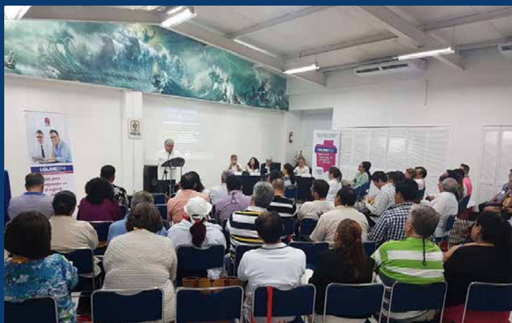
Con gran participación terminó el Colime 2018