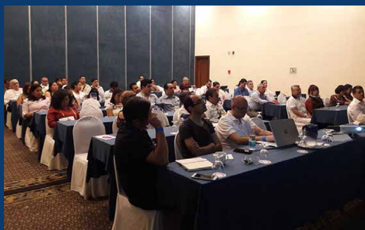
Los participantes estuvieron atentos durante los cuatro días del congreso