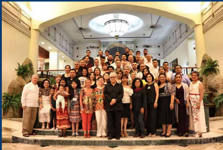
Un éxito el Colime 2018